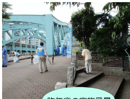
昨年度の実施風景