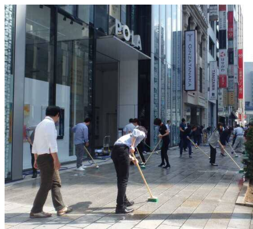
平成28年5月13日(春)の清掃風景

銀座通連合会：銀座通り、晴海通りを中心とした 約230店舗で組織する地域企業連合