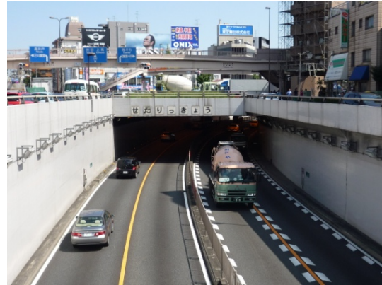
国道246号瀬田アンダー(瀬田交差点)