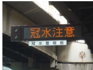
冠水情報を提供する電光標示板