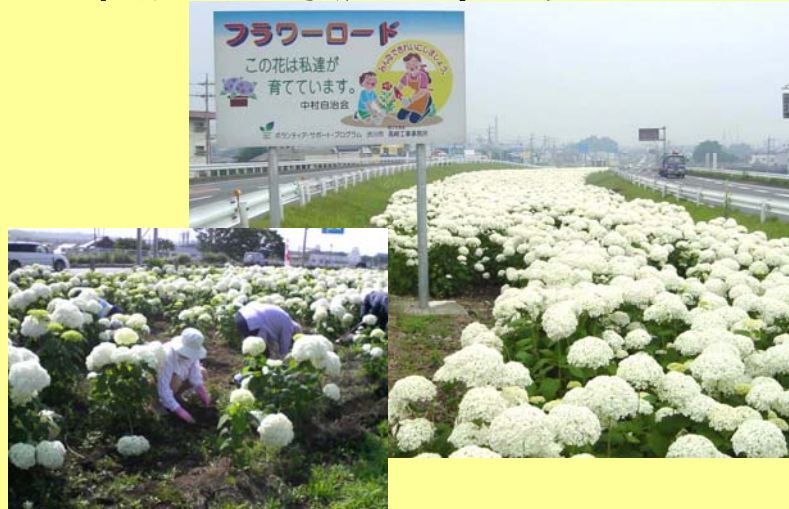
国道17号渋川市フラワーロード