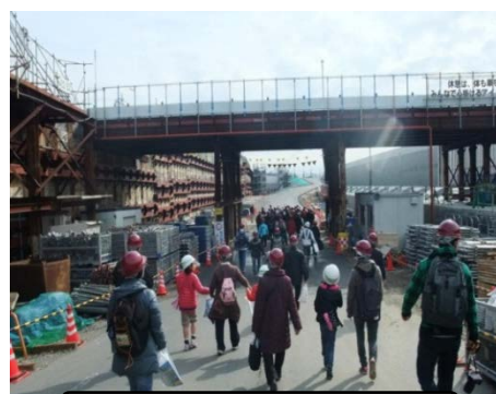
昨年度の見学会の様子

※取材については、後日、記者クラブへの「取材のご案内」で詳細なお知らせをする予定です。