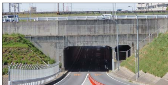
〈国道298号 上矢切隧道 (国道6号交差部)〉