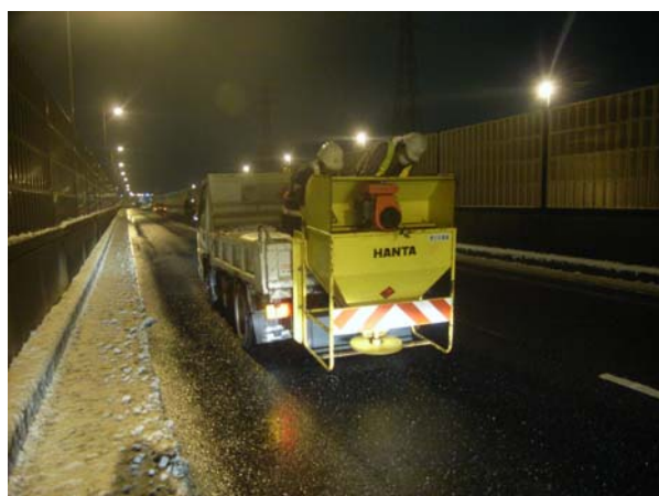
〈凍結防止剤散布状況〉

国道298号 東金町高架橋（上下線計） L=950m 国道298号 葛飾大橋（上下線計） L=800m 国道298号 小山高架橋（上下線計） L=320m 国道298号 坂川橋（上下線計） L=40m 国道298号 矢切高架橋 L=130m 国道298号 高谷川橋 L=130m 国道298号 高谷JCT（各ランプ計） L=2,600m