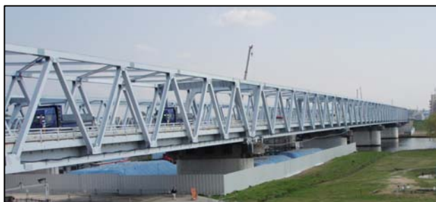
〈国道298号 葛飾大橋 (江戸川渡河部)〉