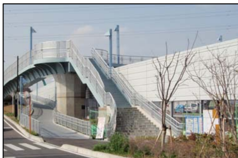
〈国道298号 矢切南台歩道橋 (横断歩道橋)〉