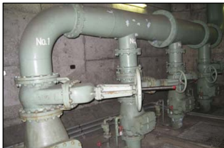
〈国道298号 小山排水機場〉