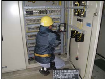
〈排水設備（電源装置点検）〉

道路管理を行う上で重要な道路管理施設（道路情報板、道路排水設備（ポンプ）等）について、点検により健全度を把握するとともに適切に作動するように管理します。