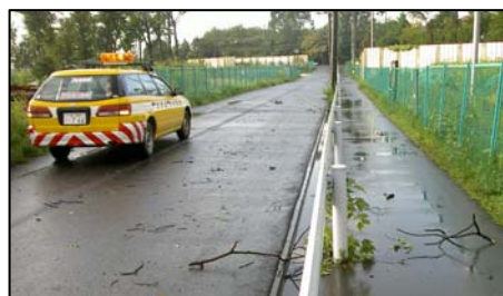
〈異常時(台風時)巡回状況〉