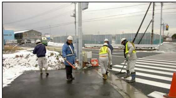
〈歩道除雪 通学路指定区間〉

歩行者の交通に支障をきたすと予想される箇所（通学指定区間等）について実施します。