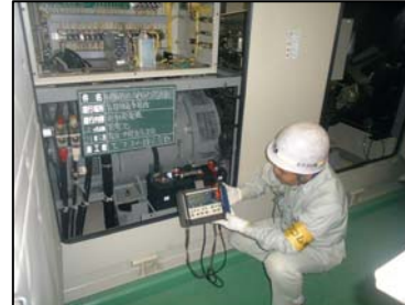
〈発電設備（蓄電池等点検）〉