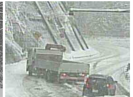
急勾配箇所車両がスリップしている状況