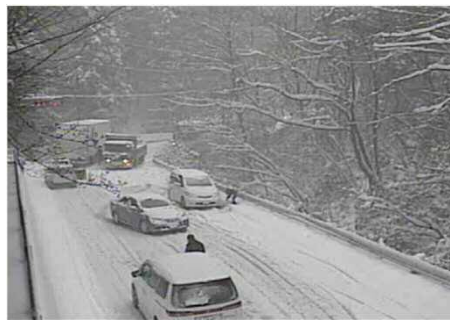
立ち往生車両発生状況

平成26年2月14日には、国道20号大垂水峠にて積雪深が最大86cmを記録する降雪が発生し、急勾配な道路で立ち往生車両が多数発生しました。積雪や交通状況に応じて、 早い段階で通行止めを行い、集中的・効率的な除雪作業を実施 いたしますので、ご理解とご協力をお願いいたします。