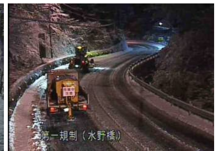
凍結防止剤散布作業状況