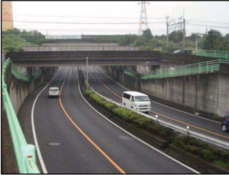
国道16号(八王子BP)中央線立体