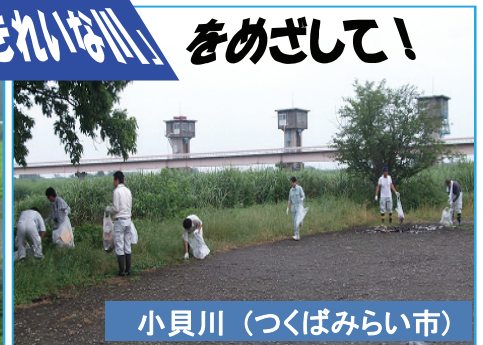
小貝川 (つくばみらい市)