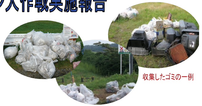
収集したゴミの一例