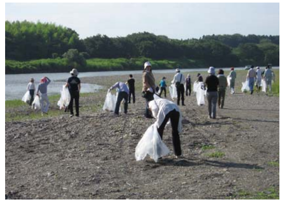
鬼怒川 (小山市中島橋下)