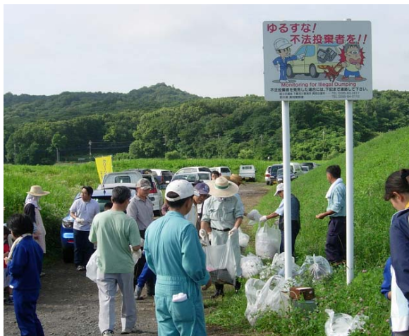
小貝川 (真岡市:阿部岡橋付近)