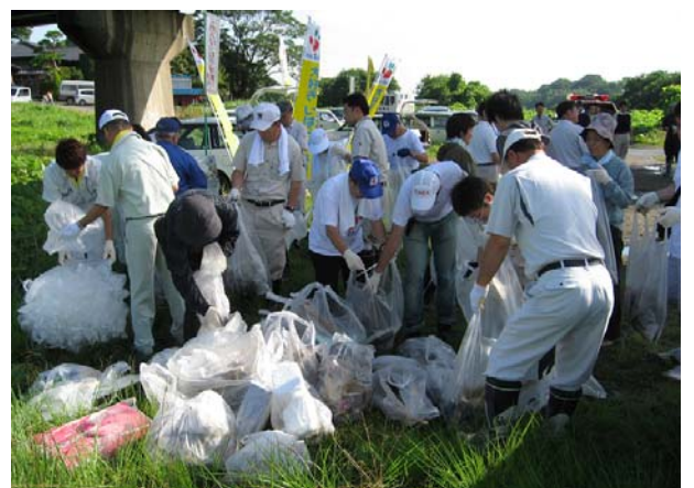
鬼怒川 (結城市栄橋下)