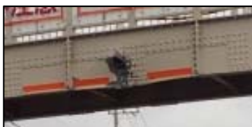
損傷箇所の拡大写真