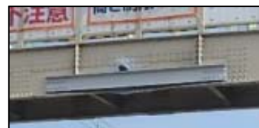
応急復旧箇所の拡大写真