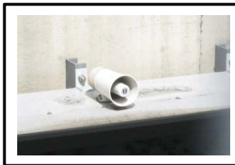
③警報装置 (音声による注意喚起)