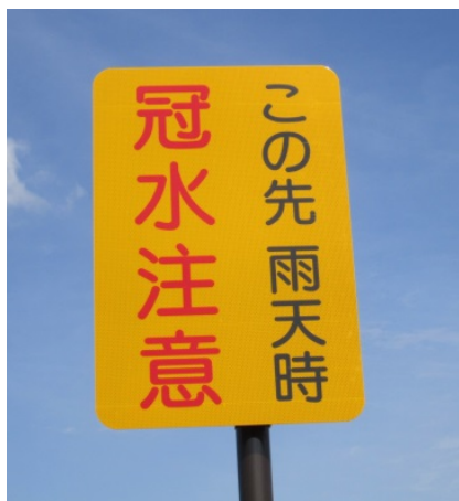
①標識(地下道手前の情報提供)