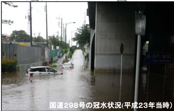
国道298号の冠水状況(平成23年当時)