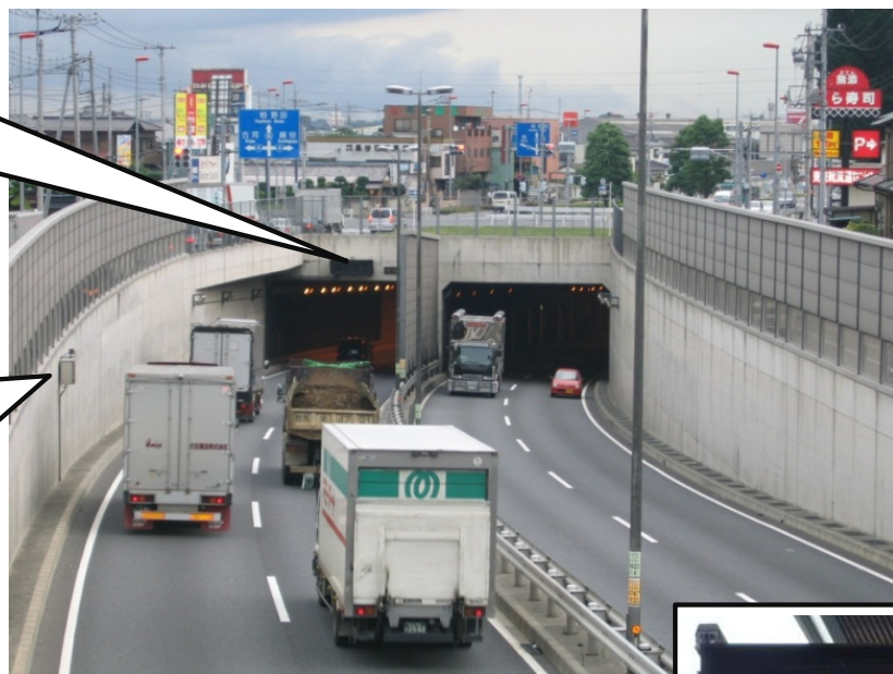
リストNo.227 国道16号 小淵立体地下道