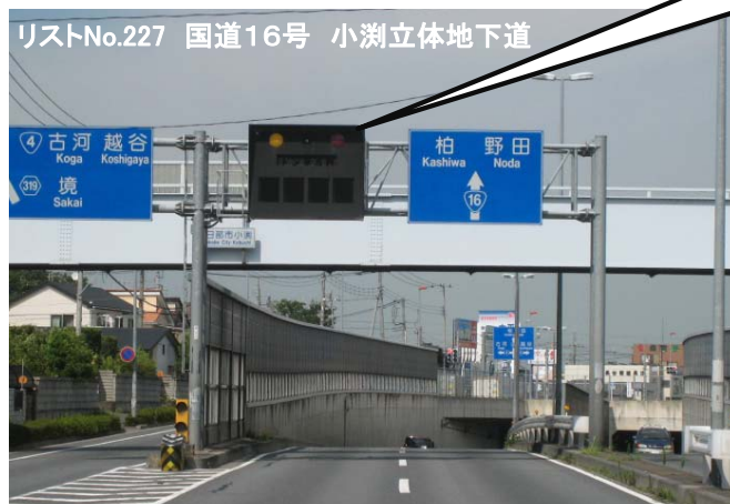
②電光掲示板(地下道手前の情報提供)