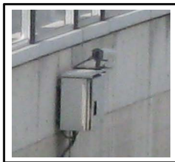
③監視装置 (カメラによる監視)