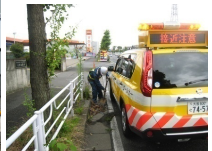
④パトロールの強化