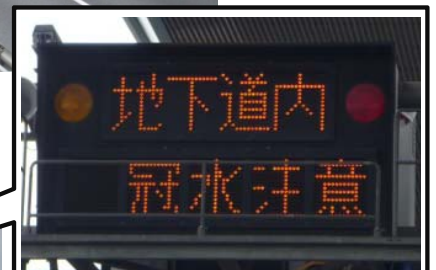
電光掲示板の表示例