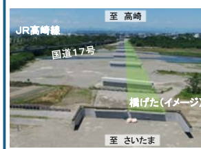
架け替えが進む神流川橋

埼玉・群馬県境に架かる現在の神流川橋は、昭和九年に完成し八〇年以上が経過した橋であり、本庄道路の中で先行して架け替えを進めております。 現在までに、橋台や橋脚が完成し、三月下旬から橋げたの架設を行う予定です。 河川内の工事のため、川の水が増える出水期の六月から一〇月を避け、限られた期間での工事となります。 工事車両は国道17号から堤防道路を通ります。安全には、十分配慮して作業に努めて参ります。