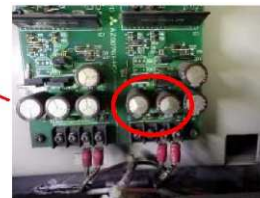
電解コンデンサ膨張