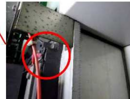
トランジスタ破損