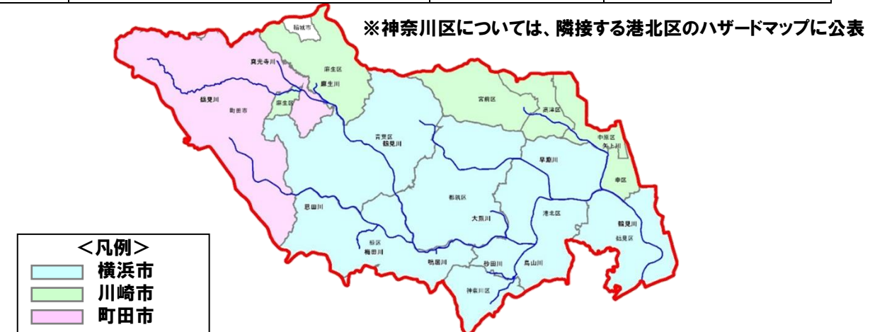
図 ハザードマップ公表状況