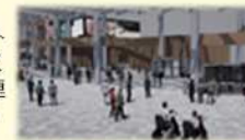
バスタの整備イメージ（山形県酒田駅）