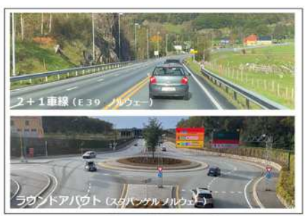
▲新たな対策の事例

車線運用の変更など従来の手法に加え、2+1車線化など、要因に即した効率的・効果的な新たな対策※を柔軟に実施