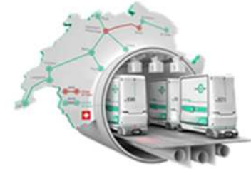
スイスで検討中の地下物流システムのイメージ