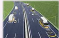
車両と道路が協調した自動運転

〔2024年度新東名高速道路、2025年度以降東北自動車道等で取組開始、将来的に全国へ展開〕