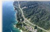
三陸沿岸道路（岩手県山田町）