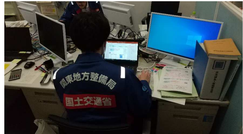
(北陸地方整備局にて資料作成)