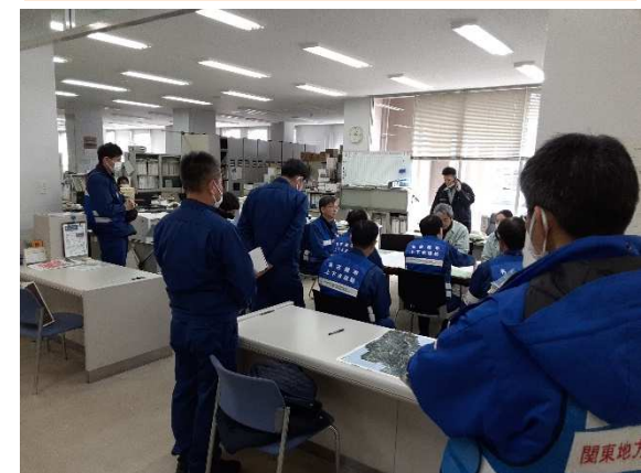
(珠洲市内での活動状況)