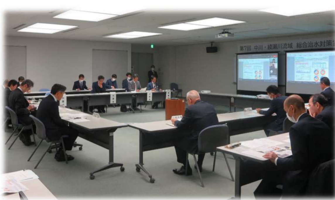
第7回 中川・綾瀬川流域総合治水対策協議会（R5.12.25）開催状況