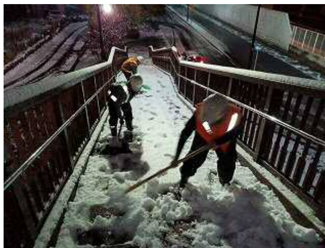
2月6日(火)6時20分に協定会社による歩道除雪及び凍結防止材散布が完了