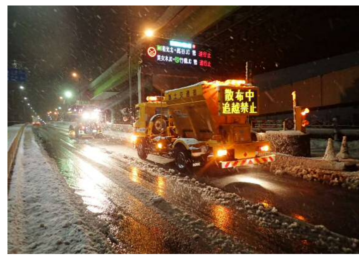
2月6日(火)0時50分に幸魂大橋のグレーダー除雪及び凍結防止材散布が完了