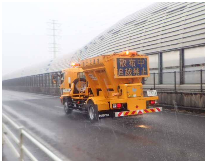
2月5日(月)14時の凍結防止材散布