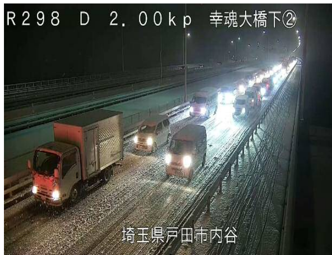
2月5日(月)18時の幸魂大橋の状況