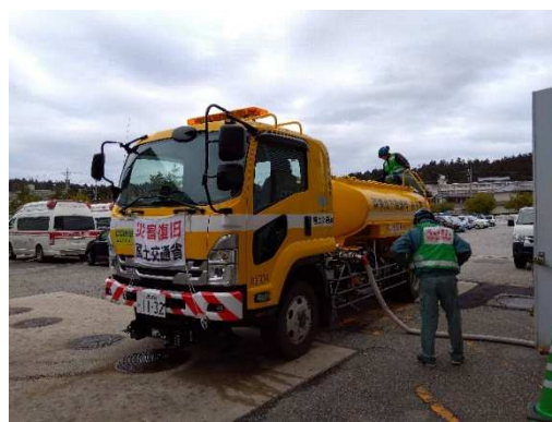
(珠洲市内での給水活動)