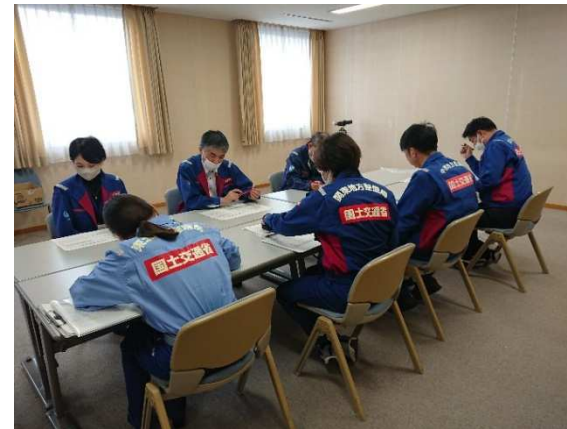
(北陸地方整備局での活動状況)