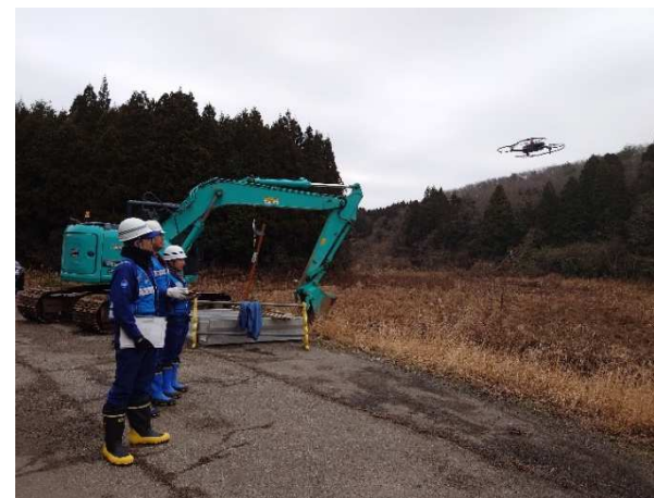
(穴水町内での被災状況調査)