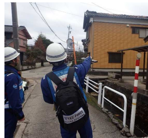
(珠洲市内での被災状況調査)