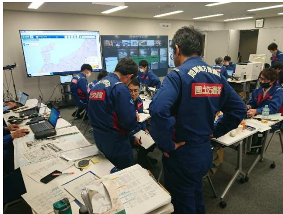
(北陸地方整備局での活動状況)