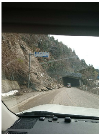
(輪島市内での被災状況調査)