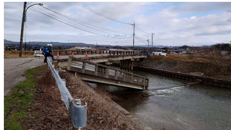
(志賀町内での被災状況調査)