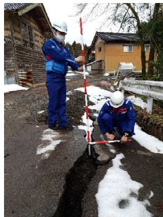
(能登町内での被災状況調査)