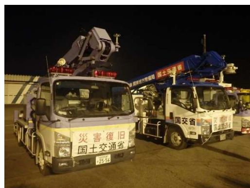
(富山防災センター)