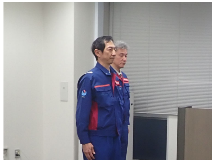
事務所長から激励