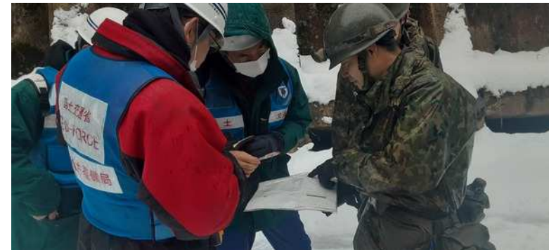
(輪島市縄又町等の被災状況調査等実施)