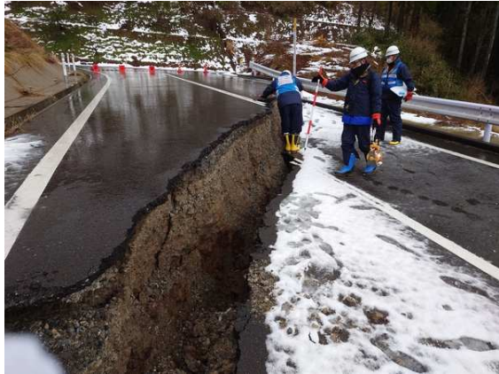
(志賀町大福寺等の被災状況調査等実施)