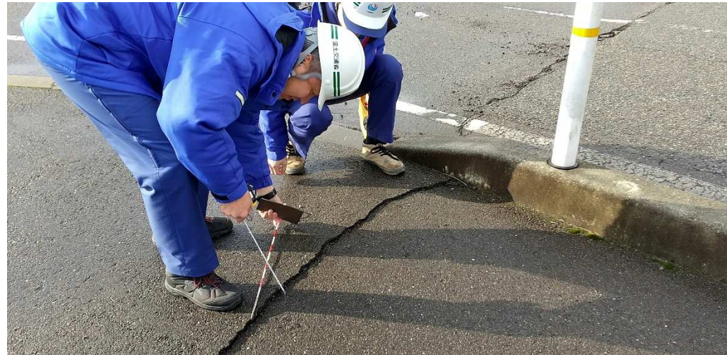
(中能登町内で調査)