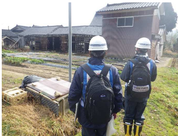
(中能登町内で調査)