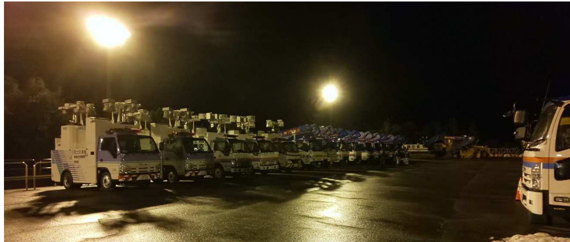
(富山防災センターに参集)