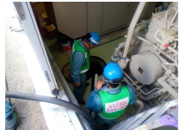
(珠洲市内で給水活動)