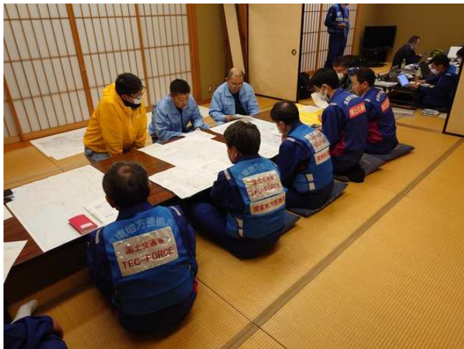
(志賀町内で打合せ)