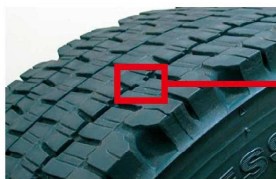
プラットホームとは新品時の溝深さから50%の位置にあるゴムの盛り上がりを設置した部分。