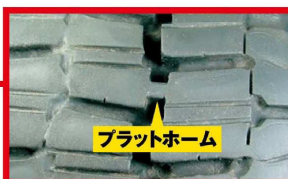
残り溝深さが「プラットホーム」に達していると冬用タイヤとして使用できません。