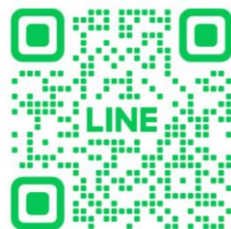
友だち登録用2次元バーコード