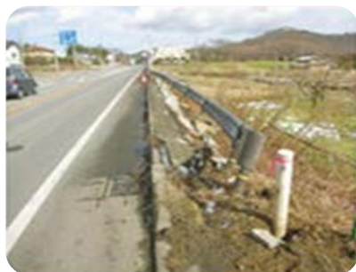
ガードレール・ 標識等の損傷