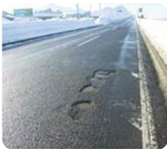
路面の穴ぼこ・ 段差