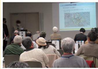
過去の川でつながる発表会の様子

新座市内の湧水や水循環に関する地点の見学、新河岸川流域の学生等による「いい川づくり」をテーマにした日頃の活動成果の発表等を行います。