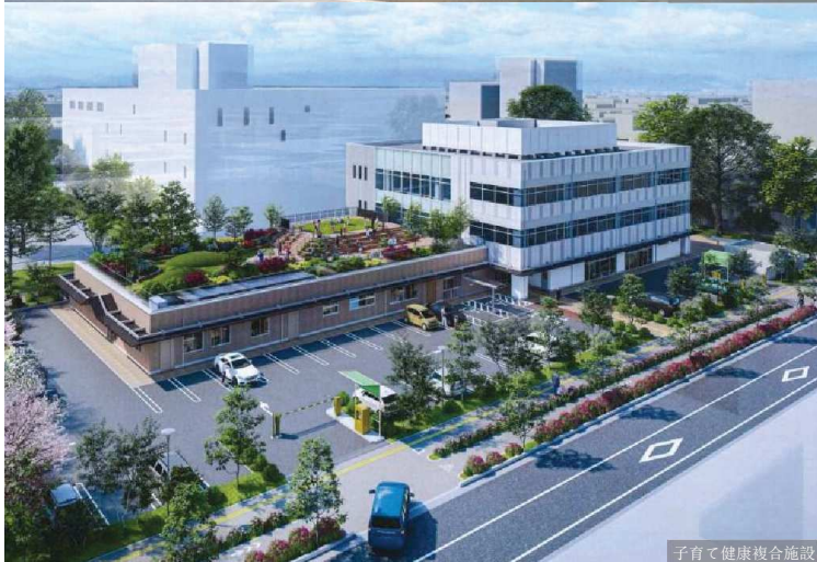
子育て健康複合施設