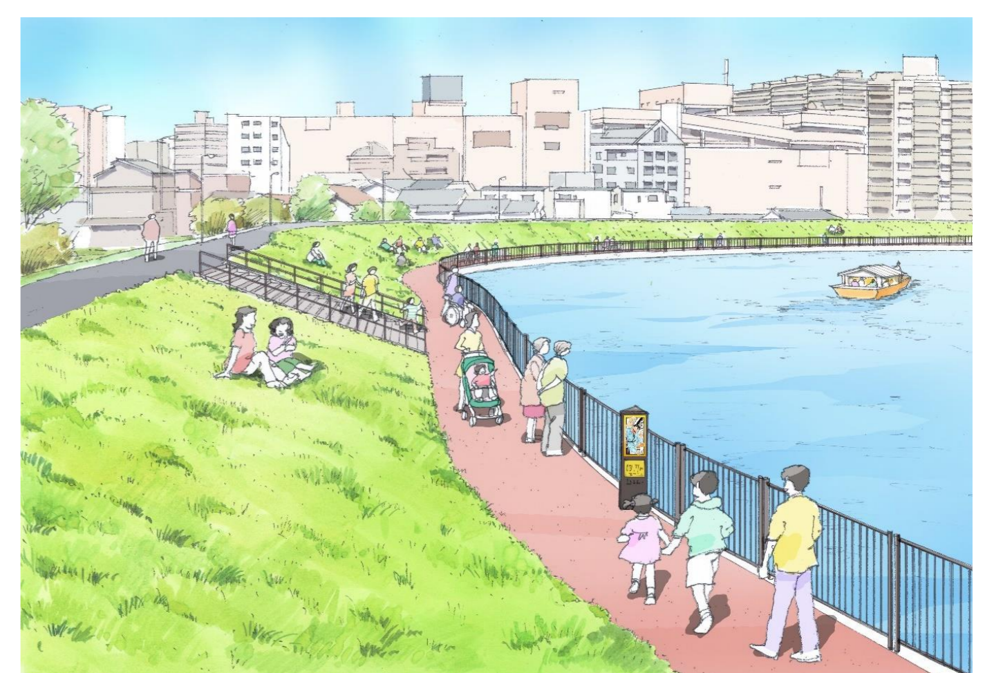
散策路部イメージ