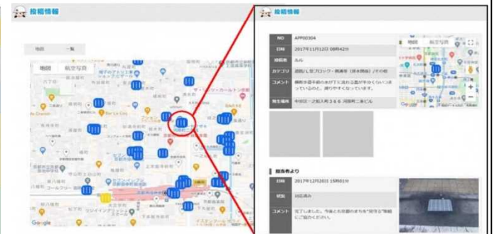
自治体HPにて、投稿情報・対応の進捗状況を確認可能