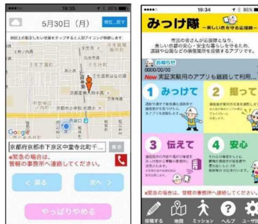
▲アプリ「みっけ隊」の画面例