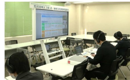
第5回 荒川流域エコネット地域づくり推進協議会