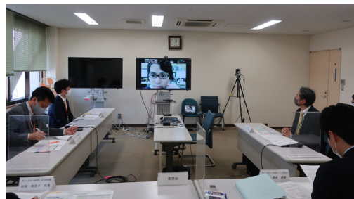
令和4年度第1回 荒川流域エリア・ワーキング 令和4年度第2回 荒川流域エリア・ワーキング