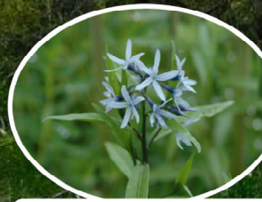
チョウジソウ 花言葉：上品なゆうがさ