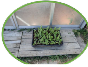
サクラソウの移植前