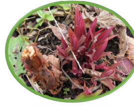
トモエソウの発芽