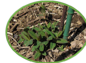
トモエソウの本葉