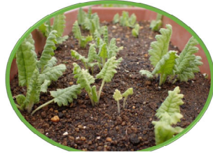
サクラソウの本葉