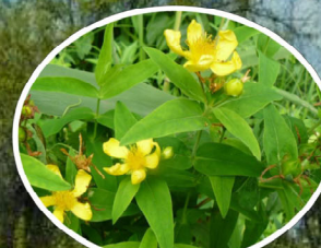
トモエソウ 花言葉：人気のある