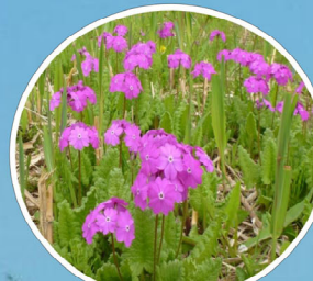
サクラソウ 花言葉：あこがれ