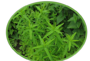
トモエソウの移植前