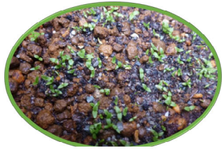
サクラソウの発芽