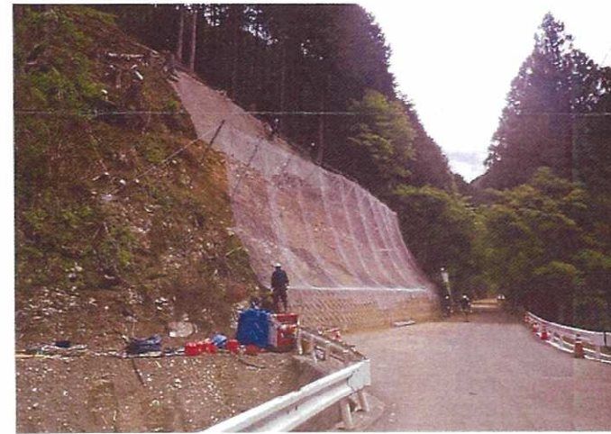
神ノ川林道 山の神先 土砂災害 工事現場(完成)