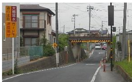
冠水前の状況 市道11019号線 川間ガード下 (道路冠水箇所リストNo27)

「車道部がアンダーパス部となっており、局地的な大雨時において冠水する可能性がある箇所」です。