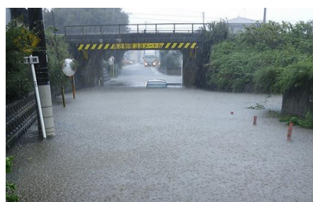
冠水状況(平成25年8月)集中豪雨 市道11019号線 川間ガード下 (道路冠水箇所リストNo27)