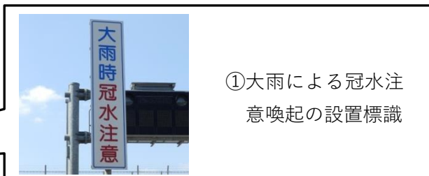
①大雨による冠水注意喚起の設置標識