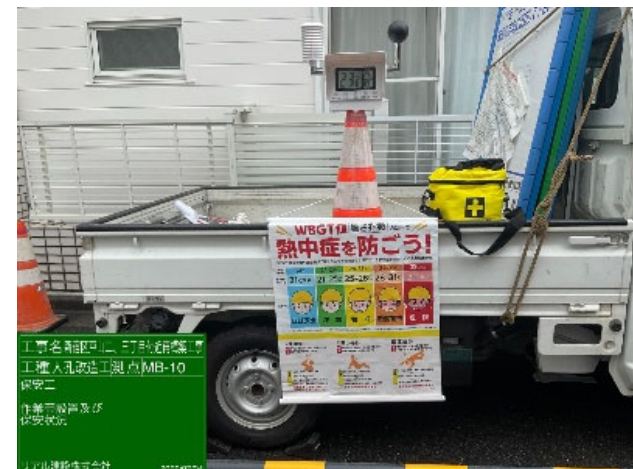
工事名 新宿区戸山二、三丁目付近再構築工事 工事種別 大規模工事 点検MB-10 役割 二 作業内容 管きよの布設替え 仮設工事 リアル建設株式会社 2024.09.01

・ 熱中症対策としてWBGT値測定器と指数ポスターを設置することにより、作業員だけでなく第三者も熱中症に対して意識が向上するように努めた。