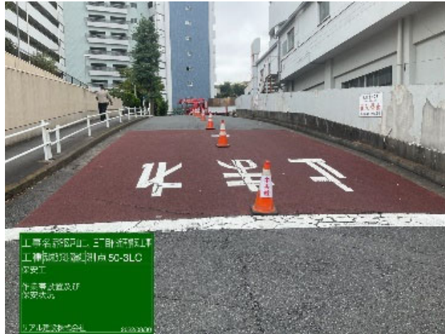
工事名 新宿区戸山二、三丁目付近再構築工事 工事種別 既設管きよ50-3LC 作業種 作業員 作業内容 管きよの布設替え及び 仮設工事 リアル建設株式会社 2024.09.01

・ 一方通行道路の通行禁止道路通行許可を取得し、う回路を設けることにより渋滞の発生等を回避した。