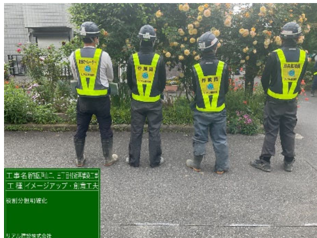
工事名 新宿区戸山二、三丁目付近再構築工事 工事種別 イメージアップ・仮設工事 役割 役割明確化 リアル建設株式会社 2024.09.01

・ 現場代理人や重機オペレータ、刃先監視員などが記載された夜光チョッキを作成し、全員が着用することにより、個人個人の与えられた仕事に対する意識向上や、第三者が監督か作業員かわかりやすいよう明確化した。