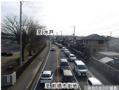
①西久保町交差点付近の渋滞状況