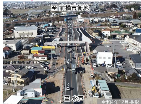
②二之宮地区の工事状況