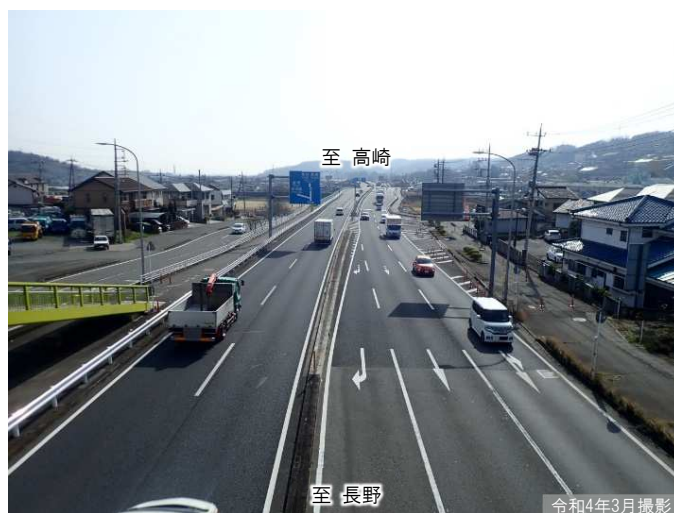
② 下野尻歩道橋から久芳橋方面の状況