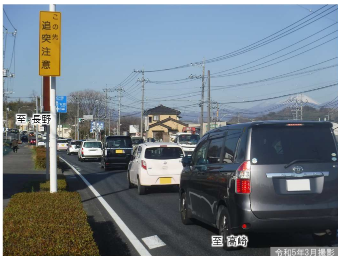
① 城下交差点付近の渋滞状況