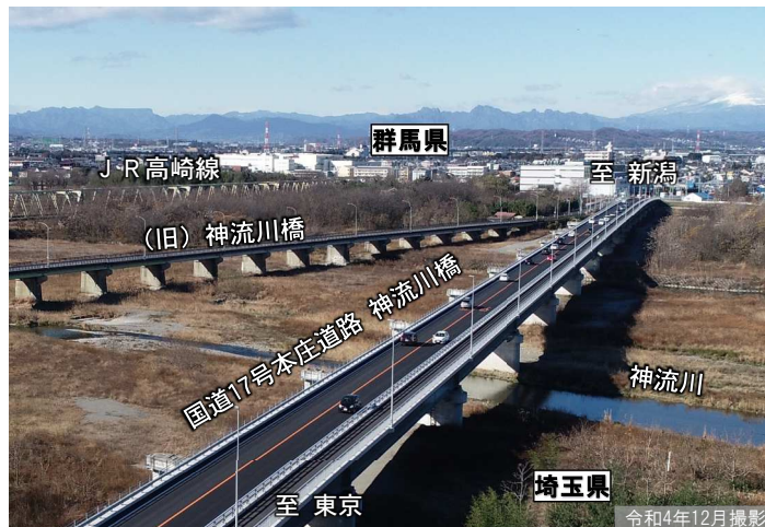
神流川橋の開通状況