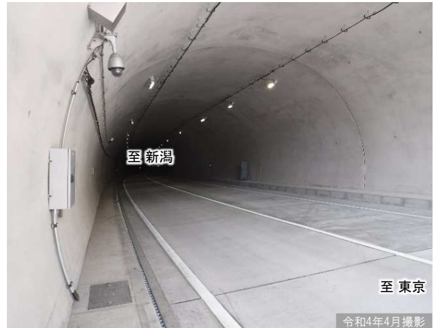
①新三国トンネルの状況