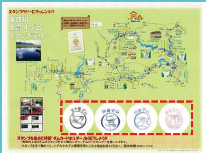
スタンプラリー台紙