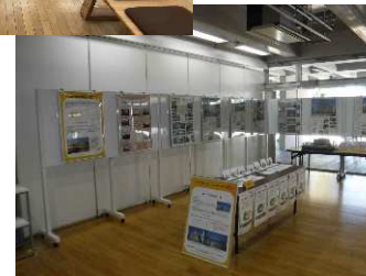
ペーパークラフト