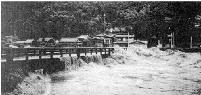
桁下高不足による支障事例