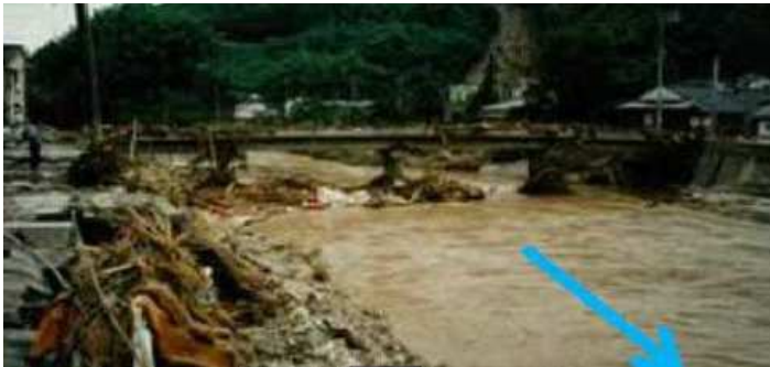
径間長不足、河積阻害による支障事例