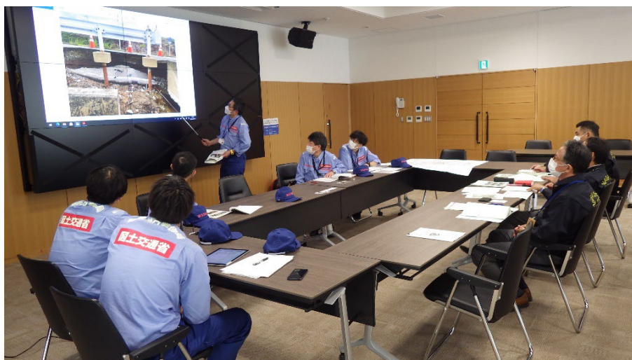
被災状況調査結果の報告状況