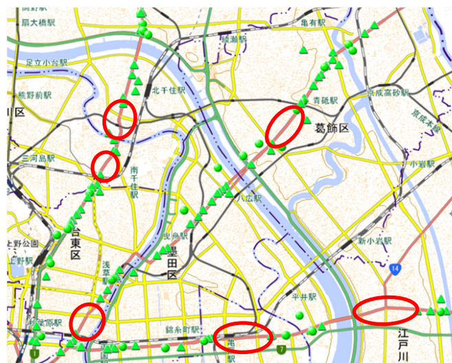
図4 行政相談プロット地図(植栽・除草)(R2・R3)

さらに、植栽(剪定要望他)及び除草に限定して行政相談プロット地図を作成すると(図4)、行政相談の件数が少ない地域がみられる。このことから、より効率的に剪定・除草の計画を立てられると考える。