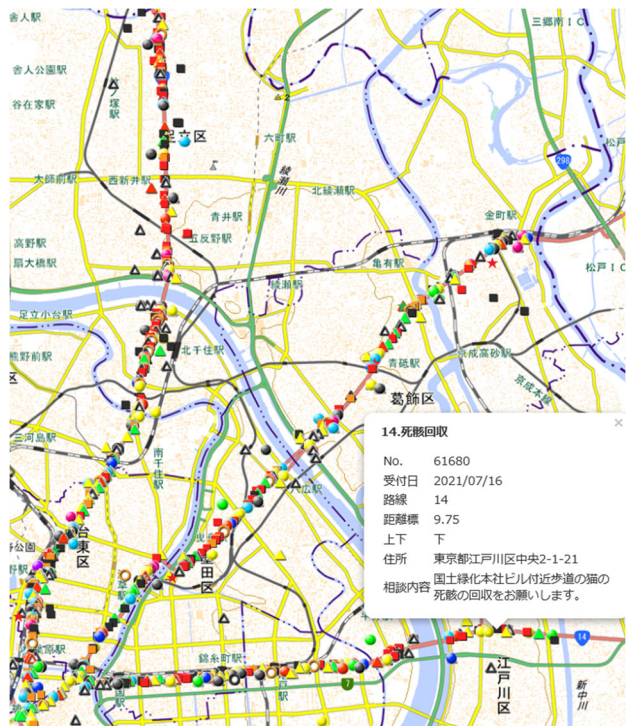
図 1 行政相談プロット地図(R3)