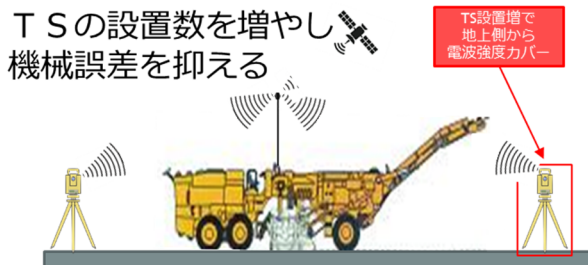
図4 TS設置数増による電波強度確保の概念図