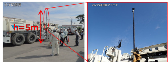
図-1 ICT切削機に付属する高さ5mのアンテナ

現道上で実施する舗装修繕工事では架空物の損傷に注意が必要だが、ICT切削機にはマシンコントロールに必要な衛星等通信用アンテナが必ず設置されており、巨大な切削機自身による電波死角をクリアするのにアンテナ高が5mあるため、場所により架空物等とアンテナが支障し作業が実施出来ないという懸念がある。