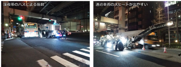
図3 現道の交通による振動のイメージ図

現道の交通による振動がマシンコントロールに誤差を生じさせ精度に影響が出るのではないかと懸念については、地上側で設置するTSの数を増やすことで位置情報の補正を強化して精度を保つことが可能と既往事例で判明している。