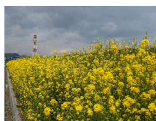
渡良瀬川堤防の菜の花

http://www.ktr.mlit.go.jp/watarase/ TEL：0284（73）5551 FAX：0284（73）8504