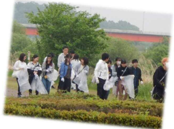
写真は令和元年度（第25回）の活動状況