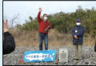
■渡良瀬川のさけについてのお話