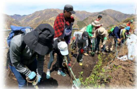
【昨年の「春の植樹デー」の様子】