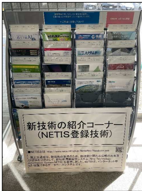
パンフレットスタンド