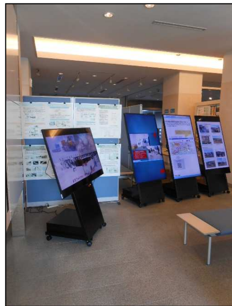
デジタルサイネージ※ (予定)

※今回の公募より展示は、パンフレットスタンド以外にもデジタルサイネージを利用した静止画や動画で行います。