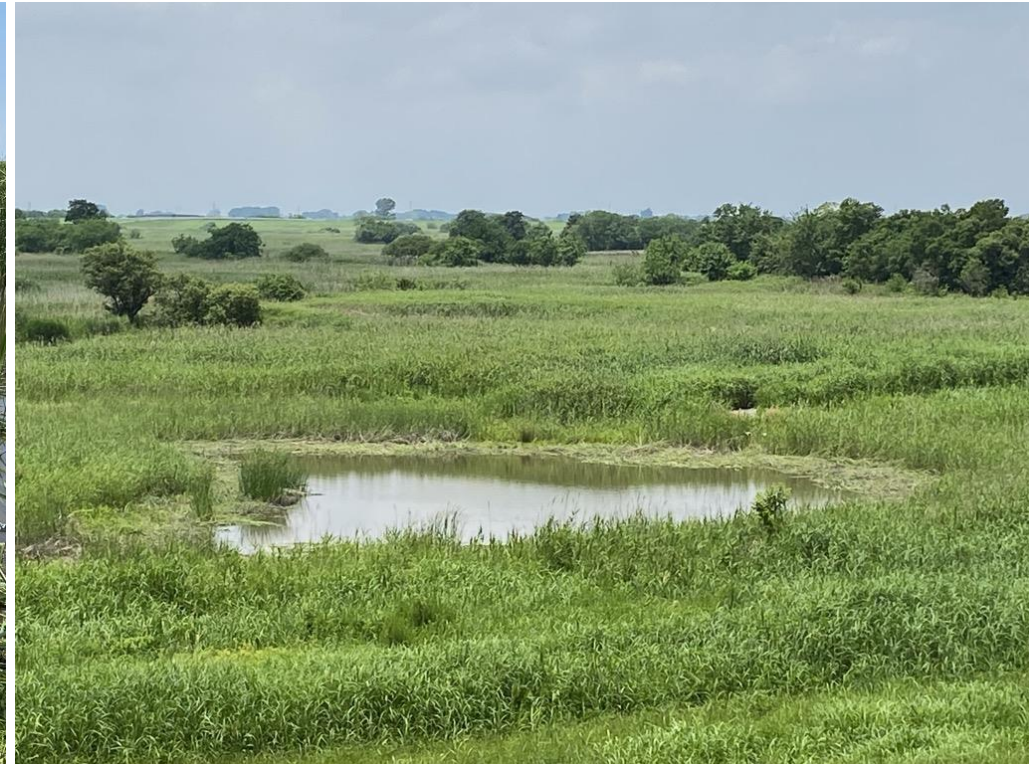
環境学習フィールド3