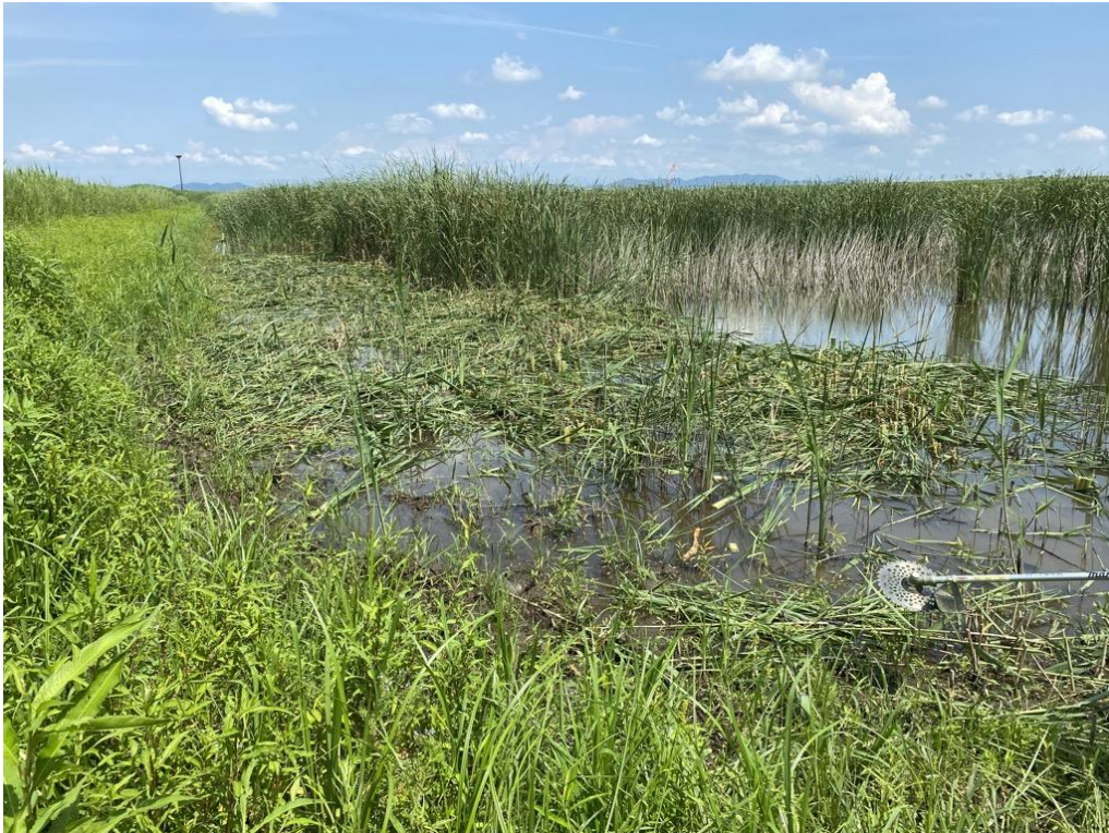
人為攪乱型実験地 (巢塔付近)