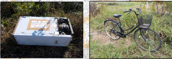
種類別ゴミの投案件数