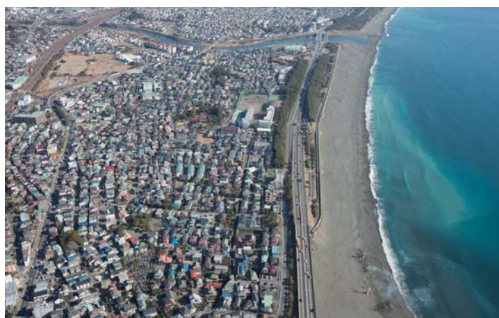
大磯インターチェンジ（仮称）付近

第II期区間は、国道1号とアクセスする茅ヶ崎西ICから南下し、茅ヶ崎海岸ICからは、国道134号に沿って平塚市を經由し、大磯町で西湘バイパスに接続します。4車線で高架構造の自動車専用道路として計画され、昭和63年9月27日に都市計画決定、平成7年12月25日に茅ヶ崎西IC～茅ヶ崎海岸IC（延長1.2km）が開通しています。インターチェンジは茅ヶ崎海岸IC、平塚IC（仮称）、大磯IC（仮称）の3箇所の計画です。