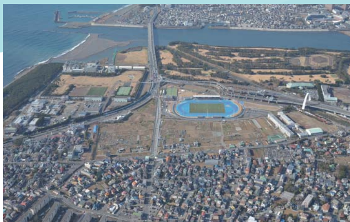
茅ヶ崎海岸インターチェンジ付近