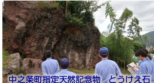
中之条町指定天然記念物 とうけえ石