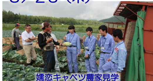
嬭恋キャベツ農家見学