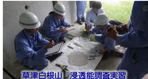
草津白根山 浸透能調査実習