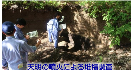
天明の噴火による堆積調査