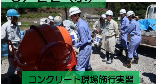
コンクリート現場施行実習