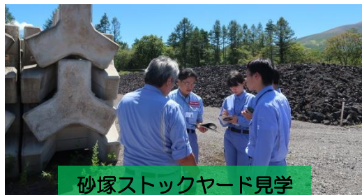
砂塚ストックヤード見学